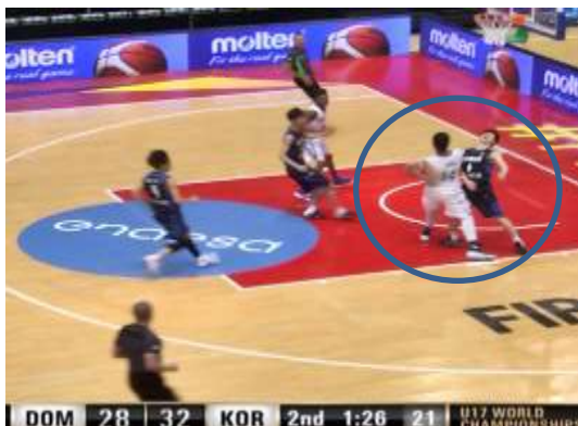
フェイクが起きたことを確認

図のように腕で招くように 2 回シグナルをすることで、フェイクが起きたことを示す