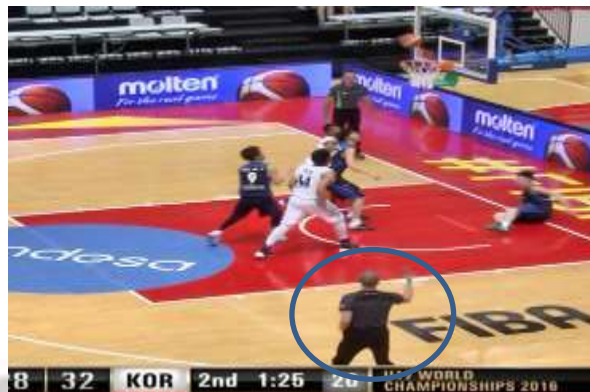
フェイクのジェスチャーを行う (2 回)